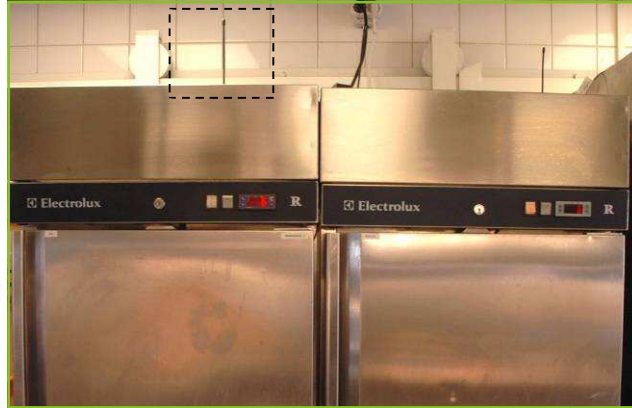
Moduł pomiarowy jest mały i łatwy w instalacji.

Moduły pomiarowe są bezprzewodowe, co sprawia, że instalacja jest szybka i prosta, bez względu na to, czy jest to zamrażarka, lada chłodnicza, kuchenka czy zmywarka. Oprogramowanie pracuje na zwykłym komputerze PC z systemem operacyjnym Windows XP. System jest elastyczny i skalowalny, i z łatwością może zostać rozbudowany do obsługi większej ilości czujników lub restauracji.